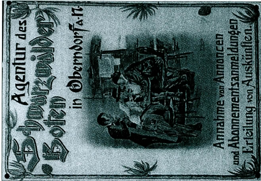
Über 100 Jahre altes Agenturschild des Schwarzwälder Boten, hergestellt vom Emailierwerk Schweizer und Söhne (heute Schweizer Electronic AG) in Schramberg.

Zunächst entdeckte Nienhaus mehr zufällig das Bild der Ansichtskarte in einer ganzseitigen Werbeanzeige des